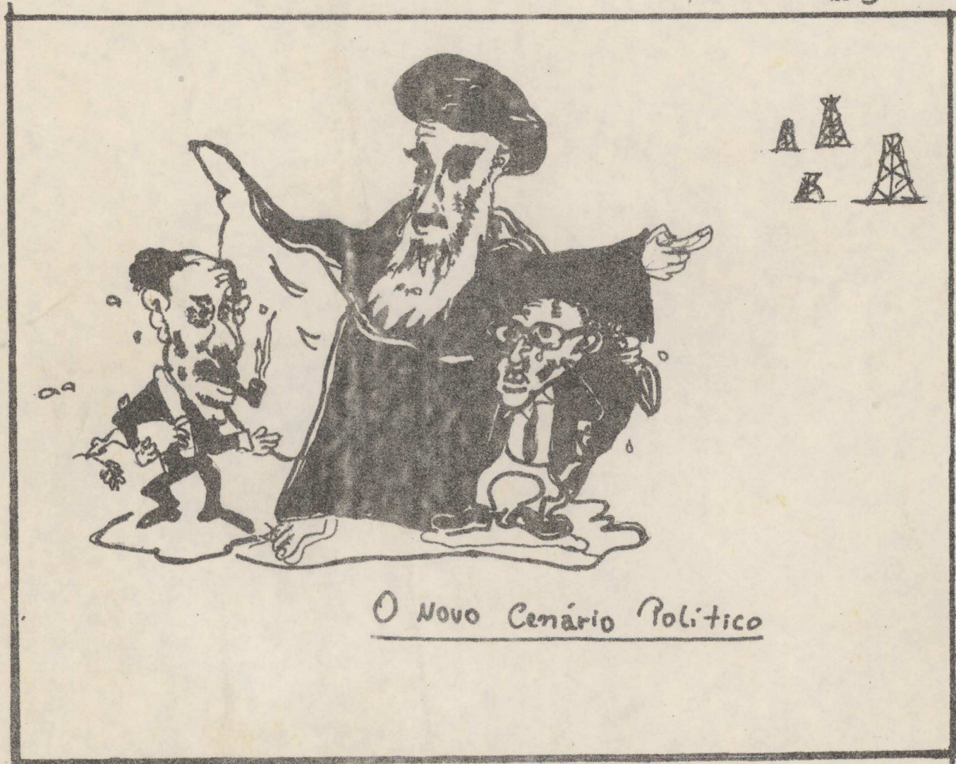
O Novo Cenário Político