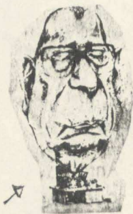
→ ... e o do "Regime".