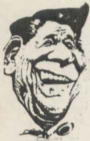
← O Patrão.