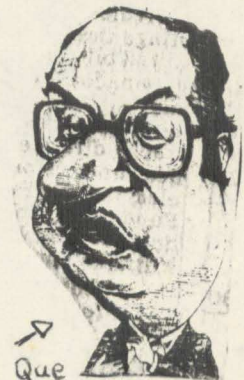
→ O Que quer chegar Lá.