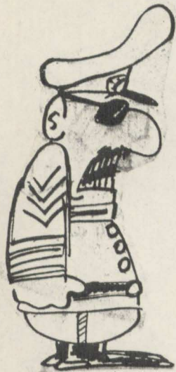
→ O "amiguinho" do Baumgarten.