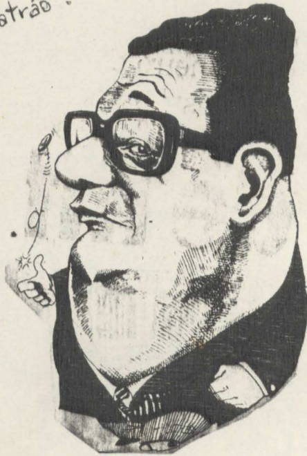
↑ O gordo ...