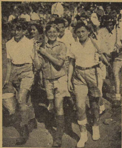
Niños judíos de una colonia de Eretz Israel dirigiéndose a plantar árboles durante una fiesta del Keren Kayémét.

Cuando la entrada en la guerra de Rusia, primero, y E. E. U. U. después, ampliaron las posibilidades de una paz cercana, volvieron los judíos a retomar