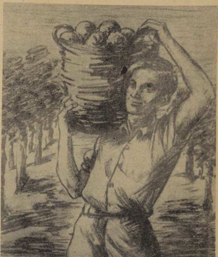
Un aspecto del trabajo en Eretz-Israel a través del lápiz de un miembro de una Kvtzá.

No sé qué es lo que la muchacha pensó de mí, después de mis palabras, que expresaban realmente aquello que sentía. Tampoco diré lo que pensó después de esa conversación. Pero algo sí sé y lo diré: si hubiera quedado contento con la conversación hubiera ido a mi casa y anotado en mi diario que la vida es hermosa, la gente es buena, la humanidad cumplirá su deber y la civilización es nuestro más caro tesoro. En cambio, si no estuviera satisfecho de la conversación hubiera tal vez ido al local y al primero que encontrara le hubiera dado una larga conferencia sobre lo malo que tiene la gente, sobre el fracaso de la civilización, sobre la tragedia de la humanidad y sobre la falta de comprensión recíproca.