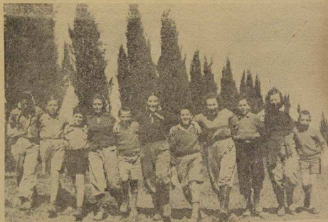
Feliz y Contenta — Así es la Juventud Palestina.

a apreciar a los hombres y las ideas del mundo. No estamos "contra el mundo, ni fuera del mundo" sino en el mundo. No es cierto que nos hemos aislado de los pueblos. Sólo hemos