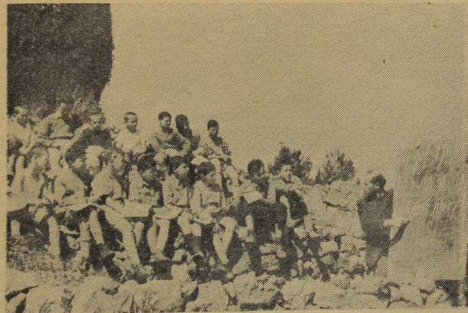
"Estamos sobre la tierra del Keren Kayemeth..."