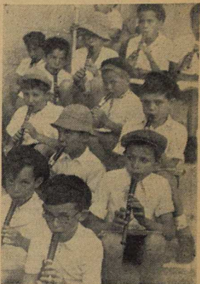
¿Qué les parece esta orquesta?