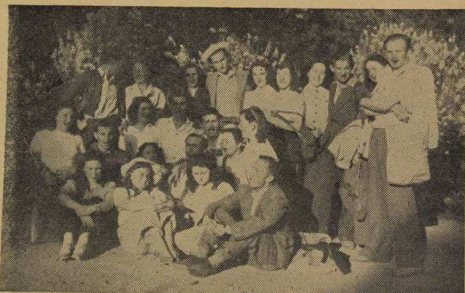
Un grupo de compañeros del "DROR" de Santiago de Chile. En el próximo número publicaremos una amplia nota sobre sus actividades.