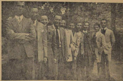
Un grupo de compañeros mayores de la sección Bahía Blanca