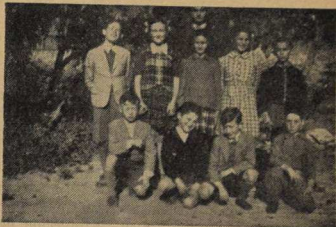
Scoitn de la sección de Bahía Blanca

La labor pro VANGUARDIA JUVENIL es excelente. Es Bahía Blanca, después de la sección CENTRO, la que más contribuye a su sostenimiento material y también literario. Tanto en el número dedicado a la Histadruth, cómo en el de la Moschavá, y en especial en el último número aniversario, la contribución de la sección Bahía Blanca fué excelente.